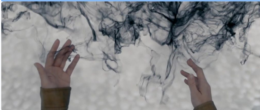
Essai de traduction de la langue circulaire des extra-terrestres, photogramme de Premier Contact, film de Denis Villeneuve

Si vous êtes intéressés à traduire les concepts de la Thérapie Contextuelle dans les langues que vous pratiquez, vous pouvez rejoindre l' Atelier traduction